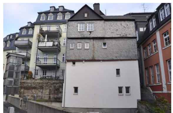
Rückansicht vor Abbruch