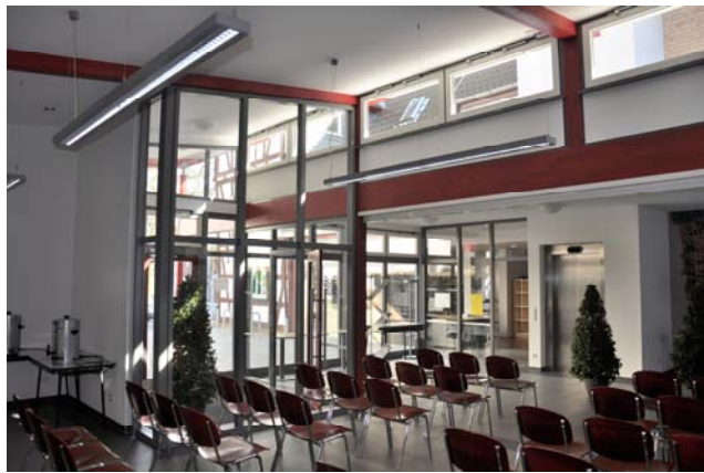
Foyer mit Eingangsbereich